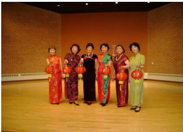
漂亮的时装秀——在 Malden 老人中心演出，获得一片赞扬。（2010 年 2 月 24 日）