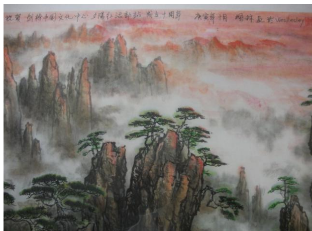
夕阳斜照，晚霞生辉，彩云飘逸，奇松傲立。我们的画家并枫林先生，特为夕阳红活动站成立十周年而作。