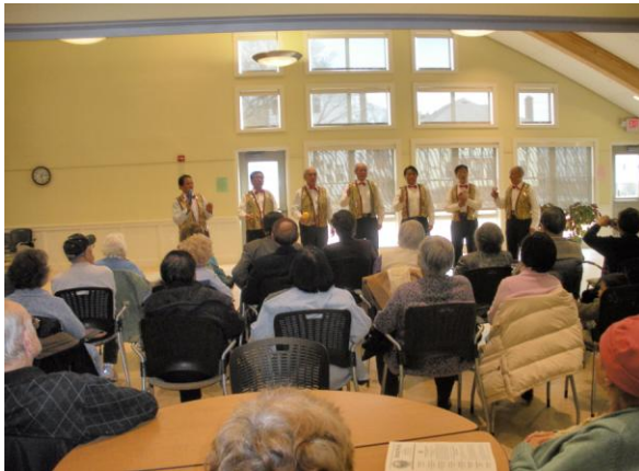
男声合唱队在 Belmont 老人中心热情地演唱“大坂城的姑娘”。（2010, 3, 2）