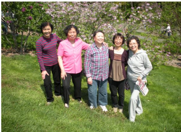
满园春色醉人心。摄于哈佛植物园。