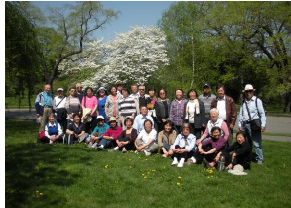
我们结伴观看丁香花，花美人更美。摄于哈佛植物园。 (2010, 5, 1)