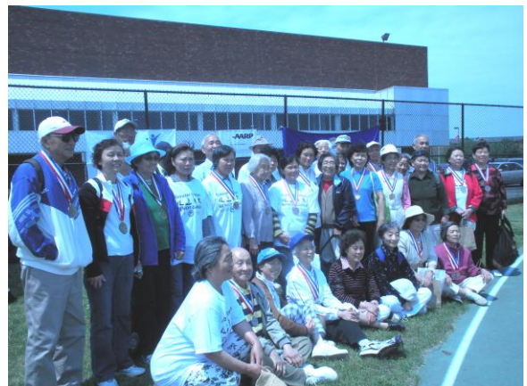
每年五月波士顿老人运动会上，《夕阳红》总是获奖大户。（09 年 5 月 23 日，我站获奖健儿合影）