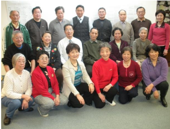
2011年元旦，现任义工合影。他们无私的奉献，将《夕阳红》的活动组织得有声有色，充满活力。