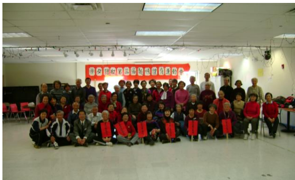
深受老年朋友喜爱的趣味运动会，这是第三届，全体运动员合影。(2010, 11, 20)