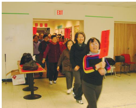
第四组代表队精神抖擞入场