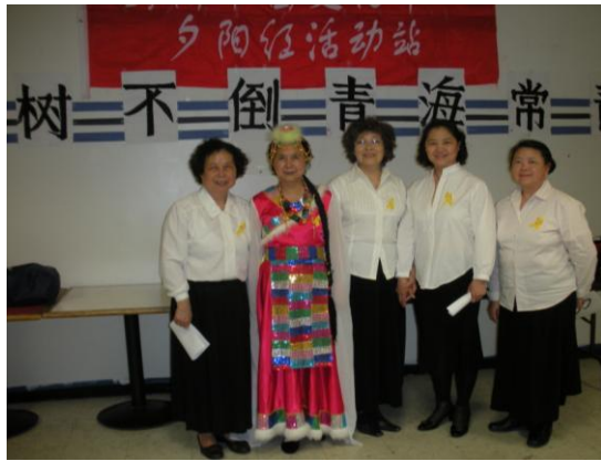
一份捐款一片心，与灾区人民心连心（2010年4月24日）歌舞献真情。（2010年4月24日）