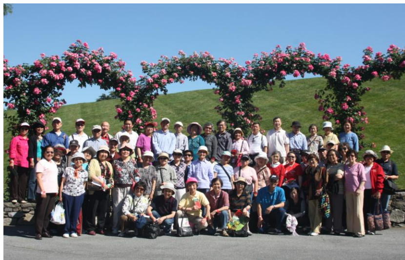
鲜花盛开的 Longwood 公园 喜迎远道来的《夕阳红》人。(2010, 5, 30)