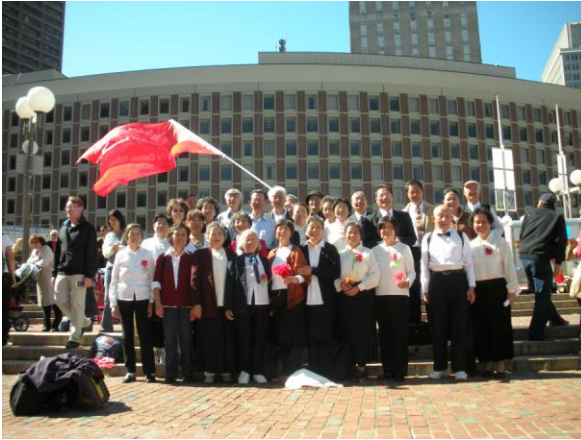
放声歌唱祖国---热烈庆祝 国庆 60 周年。（2009 年 9 月 26 日）