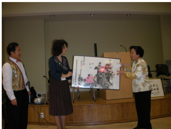
向 Belmont 老人中心赠送中国画。