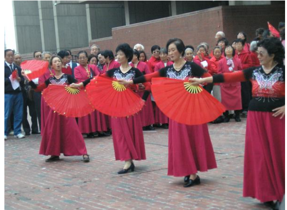
在波士顿侨、学界国庆升旗典礼上，《夕阳红》舞蹈队表演的扇舞，深受好评。