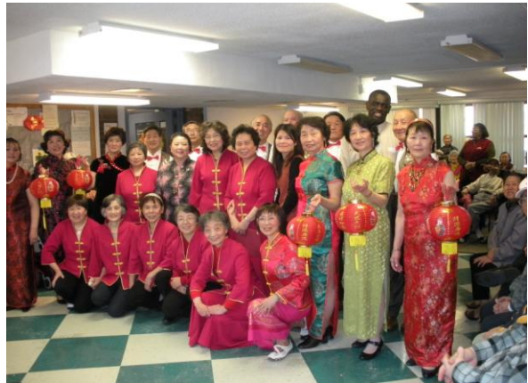
2010 年春节期间参加演出的全体演员与邀请方的组织者合影。（2010, 2, 18）