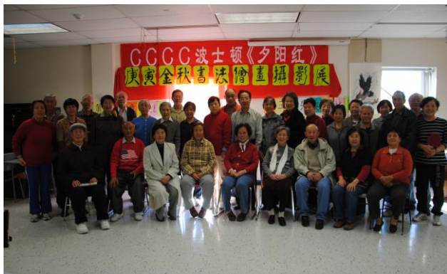
参加书法绘画展的作者与参观者合影。 (2010, 10, 23)