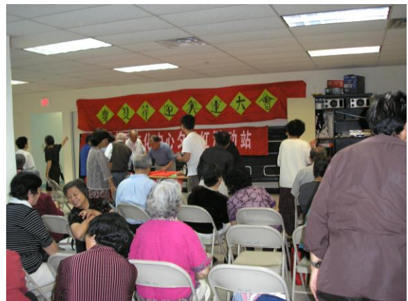
2007年9月22日，百人签名支持北京奥运。