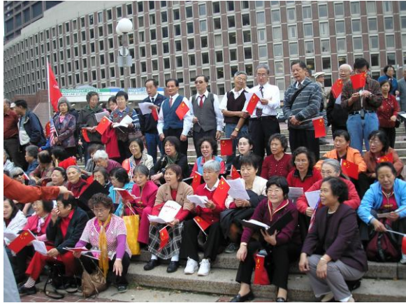
满怀激情庆祝中华人民共和国成立 58 周年（07 年 9 月 29 日）