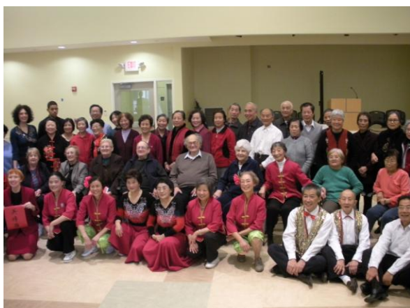
中美两国老人欢聚一堂。（2008,10,29,）