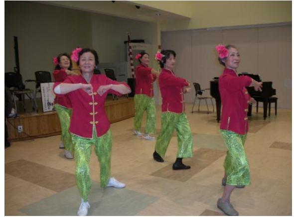
“山路十八湾”是舞蹈队的保留节目之一。