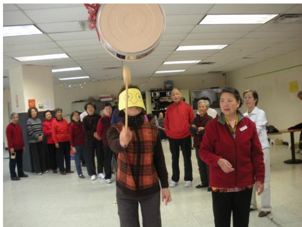
“她肯定能中头奖”。后面排队的人们是这样想的。