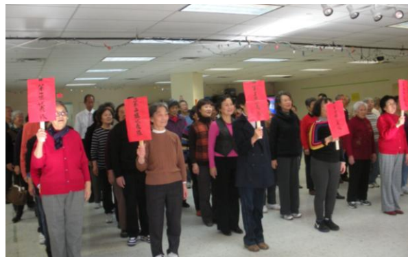
各组运动员入场式。