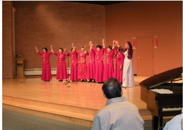
女声合唱队在 Malden 老人中心，激情演唱“走进西藏”。（2010, 2, 24）