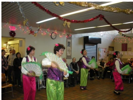
与中国城君子楼的朋友们联欢。（2009年12月22日）