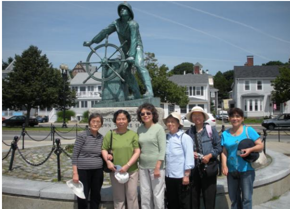
让人心旷神怡的 Gloucester (09, 7, 15)。