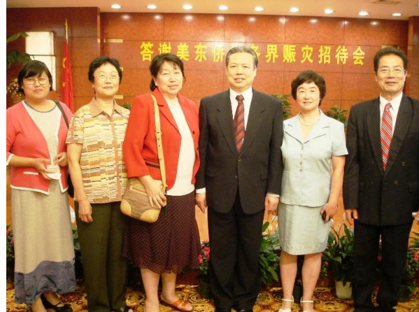
张朴、王健馨、陶凯、高青及王开成参加纽约总领馆总领事彭克玉（左4）主办的答谢美东侨学各界赈灾招待会。