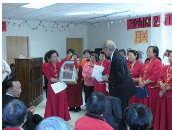
Framingham 华裔邻里会与《夕阳红》联欢，互赠礼物。（2009,3,25）