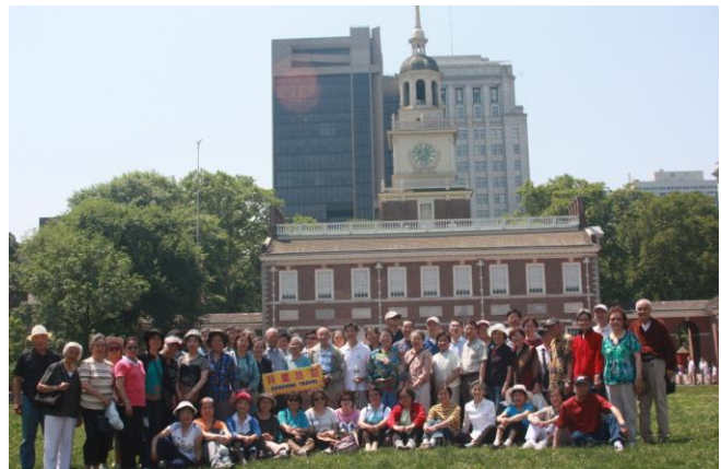
在费城独立宫前合影。(2010, 5, 31)