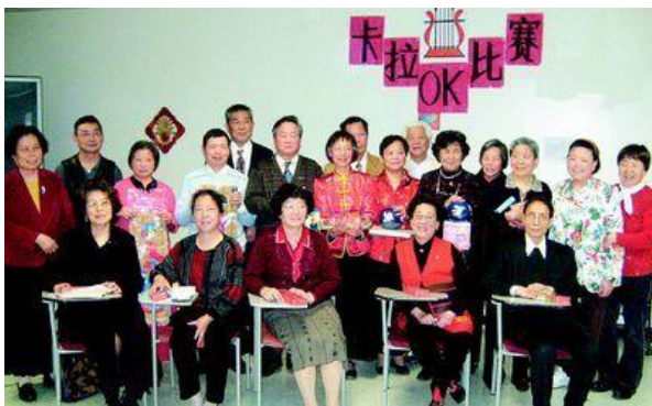
第一次卡拉OK大赛，获奖选手与评委合影。（2009年4月11日）