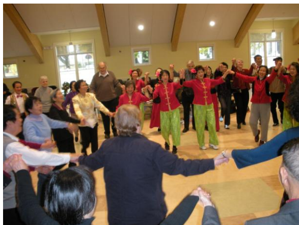
让我们手牵手，心连心，高歌友谊万年青。（2008年10月29日，与 Belmont 老人中心联欢）