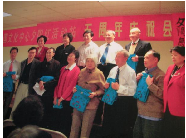
2006年4月1日，五周年庆。获奖义工合影。历届的义工们，为大家作出了爱的奉献。