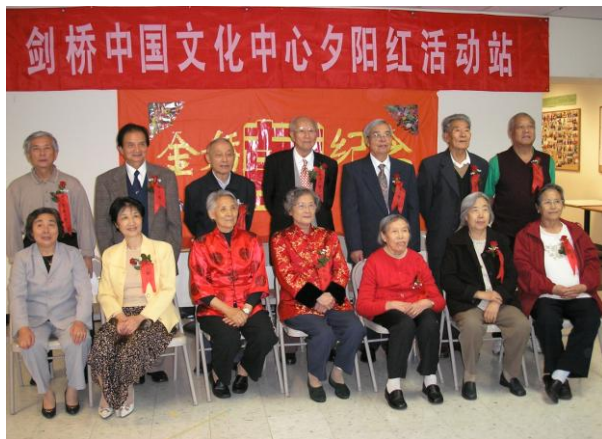
七对幸福美满的老人牵手五十年。全体《夕阳红》人为他们庆祝金婚大喜。（2007年10月20日）