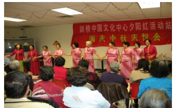
女声合唱队在国庆、中秋庆祝会上热情洋溢地歌唱。（09年10月3日）